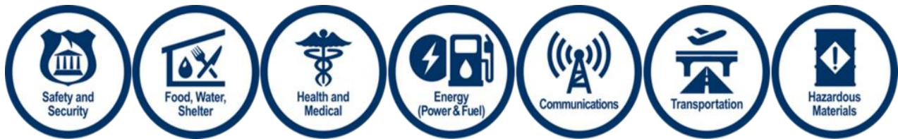
Figura 1: Líneas de vida de la comunidad

La tabla 1 ilustra el plan de Florida para la asignación de fondos del CDBG-MIT.