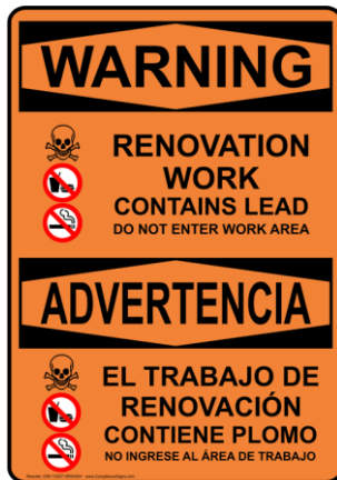
- Egzanp Pano

Si kondisyon sou sit yo pa konfòm, yo pral bay yon lòd pou sispann travay la jiskaske pèsonèl Pwogram lan rezoud epi verifye tout pwoblèm yo. Yo pral mete tan pwojè a annatant lan lè y ap kalkile konbyen tan konstriksyon ap dire e y ap konsidere se fèt konpayi konstriksyon an. Yo pral konsidere tou lòd pou sispann tout travay la lè y ap detèmine travay ki pi devan yo ak patisipasyon nan pwojè ki pi devan yo.