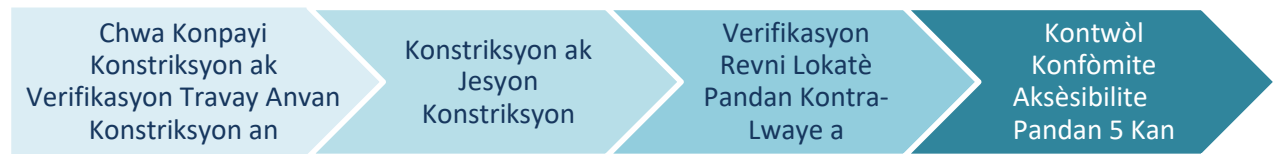
Tablo2: Konstrikasyon ak Konfòmite

Faz konstriksyon ak konfòmite a, jan ou wè li nan Tablo2, se kote yo bay pwopriyete a èd ak reparasyon, ranplasman, oswa rekonstriksyon nan aktivite konstriksyon dirèk pwogram nan fè epi fè lojman an vin yon bon pri pou mache a. Apre yo fin verifye revni lokatè a epi peryòd aksèsibilite yo ki te etabli dapre egzijans gouvènman lokal yo, y ap fèmen sibvansyon an depi pwopriyete a toujou konfòme ka tout peryòd aksèsibilite etabli dapre egzijans gouvènman lokal yo.