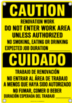
- Egzanp Pano