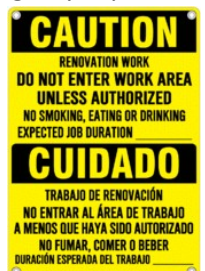
SEÑALIZACIÓN DE EJEMPLO