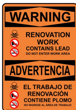
Egzanp Afich yo