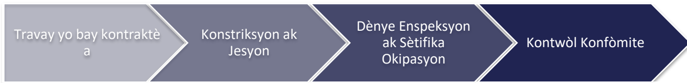
Imaj 2: Konstrikasyon ak Konfòmite

Faz konstriksyon ak konfòmite a, jan ou wè nan Imaj 2 a, se kote yo bay mèt pwopriyete a asistans lan pou reparasyon, ranplasman oswa rekonstriksyon an pa mwayen aktivite konstriksyon dirèk pwogram lan fè yo epi rezilta se yon inite lojman amenaje. Apre yo fin fè dènye aktivite konstriksyon yo ak finisman nenpòt peryòd konfòmite, y ap fèmen sibvansyon an.