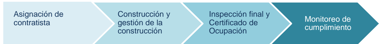
Figura 2: Construcción y cumplimiento

La fase de construcción y cumplimiento, como se muestra en la Figura 2, es cuando se provee la asistencia para reparar, reemplazar o reconstruir al propietario del inmueble a través de actividades directas de construcción realizadas por el programa y el resultado es una unidad de vivienda rehabilitada. Después de las actividades de construcción finales y la compleción de cualquier periodo de cumplimiento, se cerrará el subsidio.