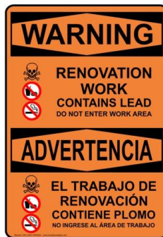
Señalización de ejemplo

Si las condiciones del sitio incumplen, se expedirá una orden de interrupción de la obra hasta que todos los problemas sean resueltos y estén verificados por plantel del programa. El tiempo que el proyecto queda en espera será incluido cuando se calcule la duración de la construcción y se considera falta del contratista. La orden de detención de todos los trabajos también se tendrá en cuenta cuando se determinen futuras asignaciones y participación en futuros proyectos.