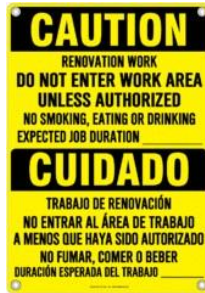
Señalización de ejemplo