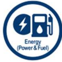
Energy (Power & Fuel)