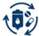
Medical Supply Chain