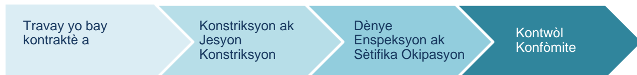
Imaj 2: Konstriksyon ak Konfòmite

Faz konstriksyon ak konfòmite a, jan ou wè nan Imaj 2 a, se kote yo bay mèt pwopriyete a asistans lan pou reparasyon, ranplasman oswa rekonstriksyon an pa mwayen aktivite konstriksyon dirèk pwogram lan fè yo epi rezilta se yon inite lojman amenaje. Apre yo fin fè dènye aktivite konstriksyon yo ak finisman nenpòt peryòd konfòmite, y ap fèmen sibvansyon an.