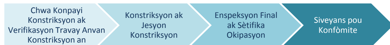
Imaj 2: Konstriksyon ak Konfòmite

Jan yo montre sa nan Imaj 2 a, faz konstriksyon ak lè pou metew an règ la koresponn a moman lè yo bay yon pwopriyetè èd nan reparasyon, ranplasman oswa rekonstriksyon gras a aktivite konstriksyon dirèk pwogram nan ap fè epi rezilta a se yon kay refèt. Aprè aktivite konstriksyon final yo epi lè peryòd konfòmite a fini, y ap klotire sibvansyon an.