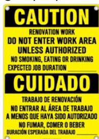
SEÑALIZACIÓN DE EJEMPLO