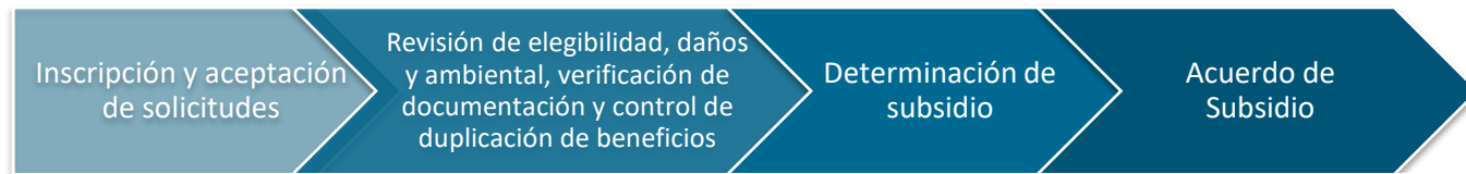
FIGURA 1: PASOS DE SOLICITUD Y DOCUMENTACIÓN INICIALES

El proceso incluye requisitos de documentación y verificación iniciales que producen una adjudicación de beneficios para propietarios elegibles. El resultado de la fase de documentación inicial es la firma de un acuerdo de subsidio.