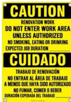
SEÑALIZACIÓN DE EJEMPLO