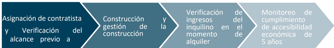
Figura 2: Construcción y cumplimiento

La fase de construcción y cumplimiento, como se muestra en la Figura 2, es cuando se provee la asistencia para reparar, reemplazar o reconstruir al dueño del inmueble arrendador a través de actividades directas de construcción realizadas por el programa y el resultado es una unidad de vivienda accesible y lista para el mercado. Después de la verificación de los ingresos del inquilino y la finalización del periodo de accesibilidad económica para unidades en alquiler unifamiliares, que es un mínimo de un año, el subsidio cerrará suponiendo que el dueño del inmueble ha mantenido el cumplimiento a lo largo del término del periodo de accesibilidad económica.