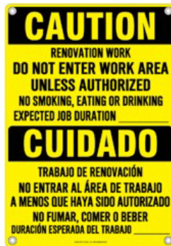
Egzanp Afich yo