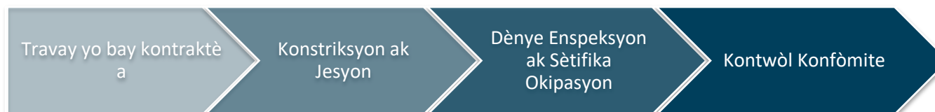
Imaj 2: Konstriksyon ak Konfòmite

Faz konstriksyon ak konfòmite a, jan ou wè nan Imaj 2 a, se kote yo bay mèt pwopriyete a asistans lan pou reparasyon, ranplasman oswa rekonstriksyon an pa mwayen aktivite konstriksyon dirèk pwogram lan fè yo epi rezilta se yon inite lojman amenaje. Apre yo fin fè dènye aktivite konstriksyon yo ak finisman nenpòt peryòd konfòmite, y ap fèmen sibvansyon an.